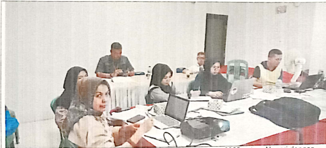
Pembahasan Dokumen APB Perubahan Nagari Tahun Anggaran 2023 antara Nagari dengan Tim Evaluasi Tk. Kecamatan