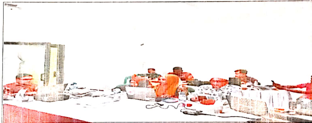
Pembahasan Dokumen APB Perubahan Nagari Tahun Anggaran 2023 antara Nagari dengan Tim Evaluasi Tk. Kecamatan