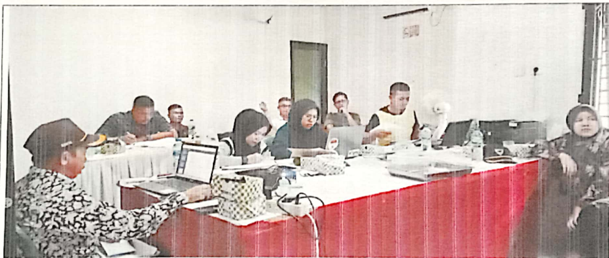
Pembahasan Dokumen APB Perubahan Nagari Tahun Anggaran 2023 antara Nagari dengan Tim Evaluasi Tk. Kecamatan