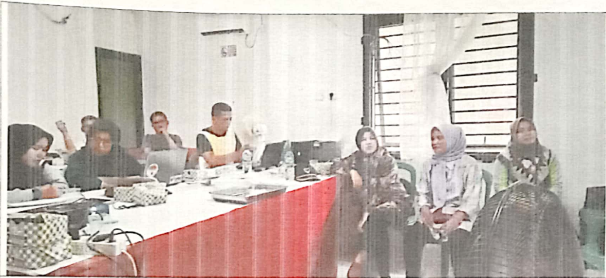
Pembahasan Dokumen APB Perubahan Nagari Tahun Anggaran 2023 antara Nagari dengan Tim Evaluasi Tk. Kecamatan