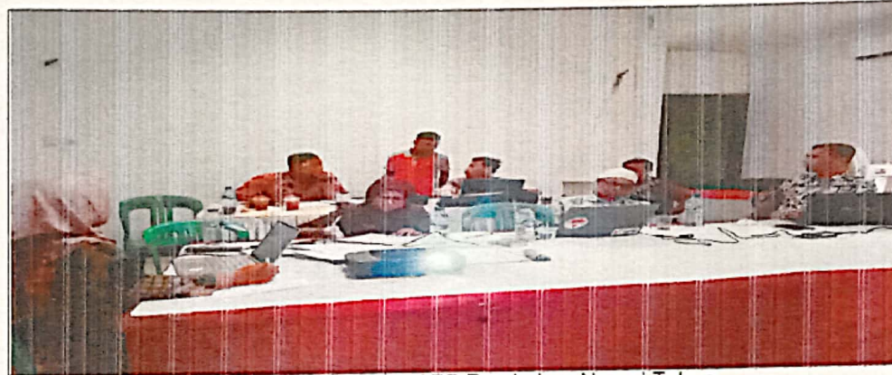
Pembahasan Dokumen APB Perubahan Nagari Tahun Anggaran 2023 antara Nagari dengan Tim Evaluasi Tk. Kecamatan