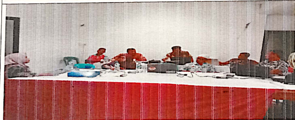
Pembahasan Dokumen APB Perubahan Nagari Tahun Anggaran 2023 antara Nagari dengan Tim Evaluasi Tk. Kecamatan