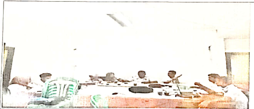
Pembahasan Dokumen APB Perubahan Nagari Tahun Anggaran 2023 antara Nagari dengan Tim Evaluasi Tk. Kecamatan